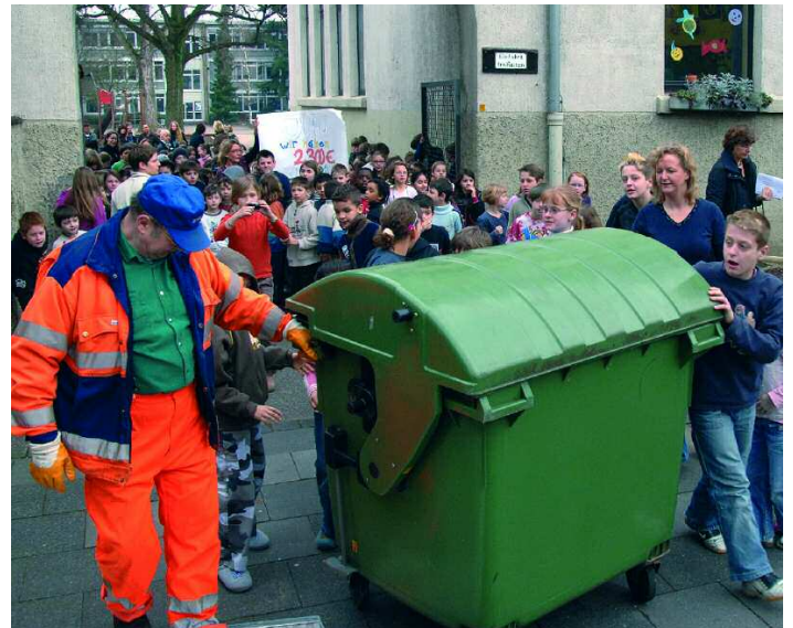
Gestaltungskompetenzen für die Zukunft, das will die Kampagne Schülerinnen und Schülern vermitteln. Nach der Umsetzung eines Müllvermeidungskonzeptes verabschieden sich die Schülerinnen und Schüler der Herzogschule Leverkusen von einer überflüssigen Mülltonne.