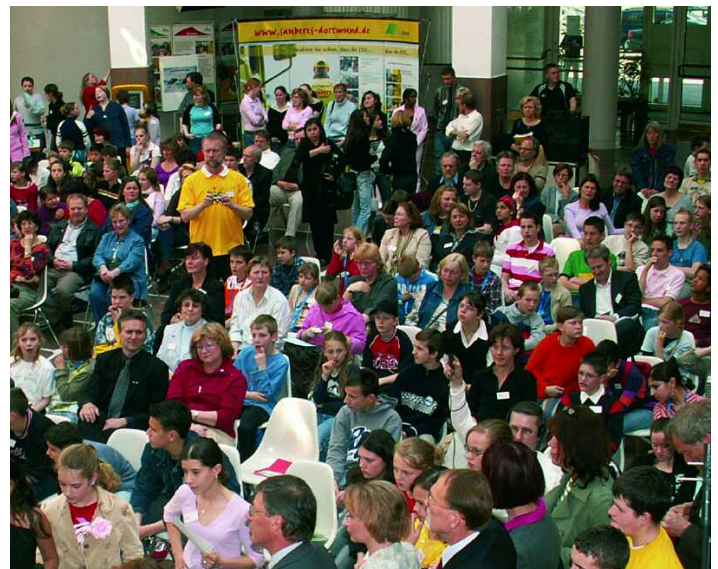
Das Dortmunder Netzwerk der Agendaschulen bietet mit großen Schülerkongressen ein Forum, auf denen Schulen ihre Projekte präsentieren.