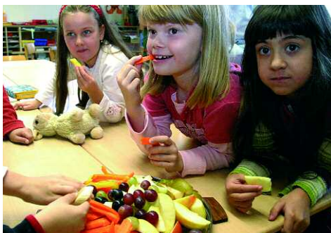
An vielen Schulen werden Produkte aus dem eigenen Garten oder der Region handlungsorientiert im Unterricht eingesetzt. Foto: Gesundes Schulfrühstück an der Grundschule Dehme