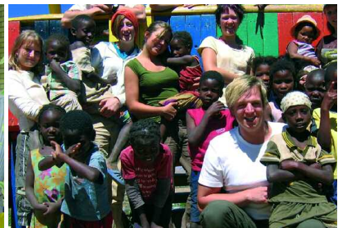
Um junge Menschen fit zu machen für die Zukunft müssen sie auch globales Denken und Handeln lernen. Viele Schulen pflegen deshalb Partnerschaften mit Ländern der Einen Welt wie z.B. die Lisa Meitner Gesamtschule in Köln.