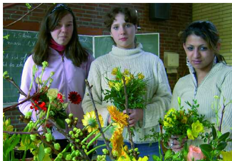
Der Betrieb einer Schülerfirma fördert zugleich die ökologische und ökonomische Kompetenzen von Schülerinnen und Schülern. „Schülerfirma Garten“ der Albert-Schweitzer-Förderschule Bergkamen.